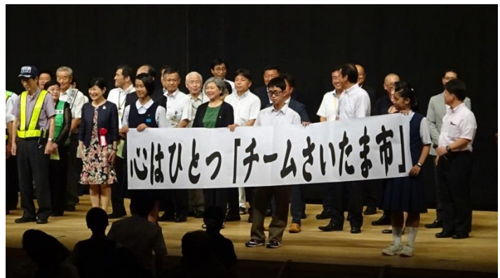
「8/24（木）「さいたま市いじめ防止シンポジウムから」

力をつけられる充実した学校生活が過ごせるよう2学期も、教職員一丸となり、精一杯進めてまいります。そして、「夢いっぱい 笑顔いっぱい 心のふるさと浦和大里小学校～元気にあいさつ、活動にメリハリ、落ち着いた雰囲気のある学校～」を目指します。