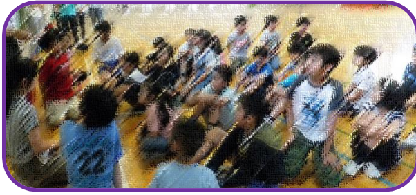
↑チーム分けのメンバー発表を聞いています。

半は、ブックランドから体育館に移動して「ドッジビー」にチャレンジしました。いつもそうですが、児童の皆さんは元気いっぱい！体育館につくとすぐにフロアじゅうを駆け回っていました。今回は、珍しい事がありました。いつもは「集合！」の声をかけてもいつまでも駆け回っていたりする児童がいて集合まで時間がかかりますが、今回は「集合！」の声を掛けなくても全員が集まってきたことです。おしゃべりも早いうちに静かになりました。これからもこんな状態が続くと良いですね。みなさんならきっとできますよ。